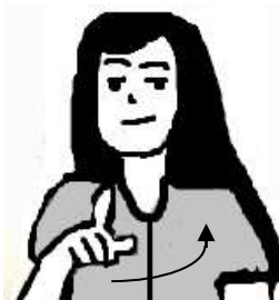
FIG. 3: Ter