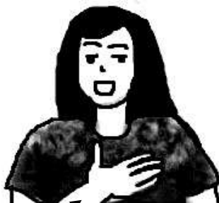
FIG. 1: Gostar

No caso dos sufixos, a negação se associa a raiz alterando um dos parâmetros do sinal, especialmente o parâmetro movimento. Assim, o movimento contrário ao da base concluindo o movimento, caracteriza a negação incorporada, como no exemplo do verbo gostar :