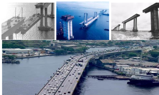
50 ANOS DE EXISTÊNCIA DA PONTE RIO–NITERÓI.