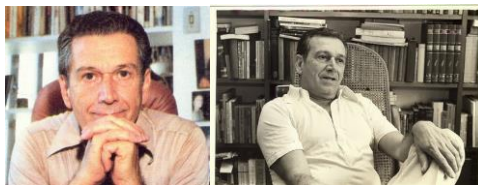
FERNANDO SABINO (1923–2004).