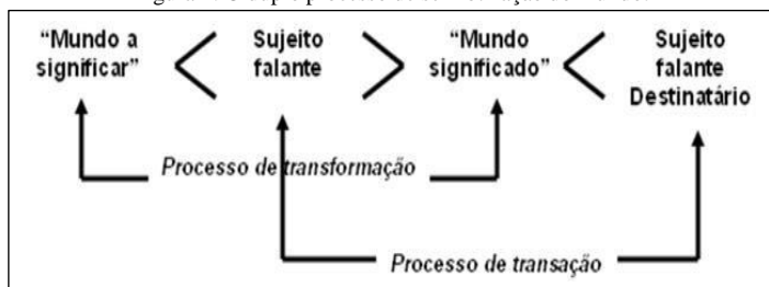
Figura 1: O duplo processo de semiotização do mundo.

Dessa maneira, é possível entender que semio- , trazendo sentido de meio, metade, incompleto, funciona em conjunto com a linguística, tornando-a completa no sentido da comunicação. O autor exemplifica isso ao mostrar o duplo processo de semiotização do mundo, onde o significante passa a ser significado, entre o sujeito falante e o destinatário: